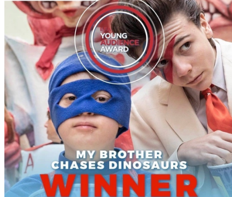
Von der Jugendjury zum besten Jugendfilm Europas 2020 gekürt: Die berührende italienische Filmproduktion MI FRATELLO RINCORRE I DINOSAURI