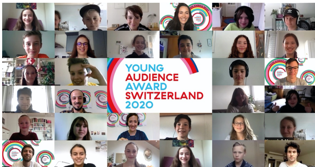
Teilnehmer_innen der online Ausgabe YAA 2020 (Lausanne und Luzern, Fotocollage)